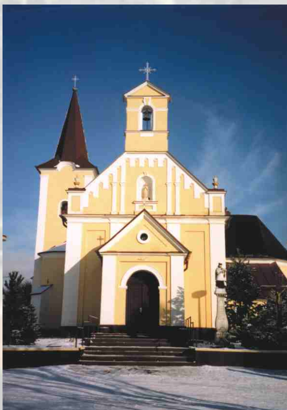
Rímsko - katolícky kostol - dominanta námestia