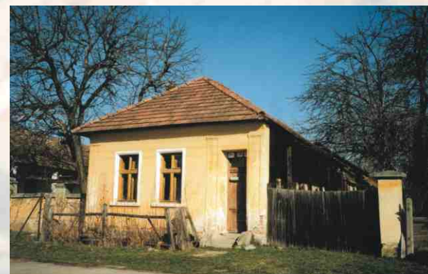
Zachovalá architektúra obytného domu