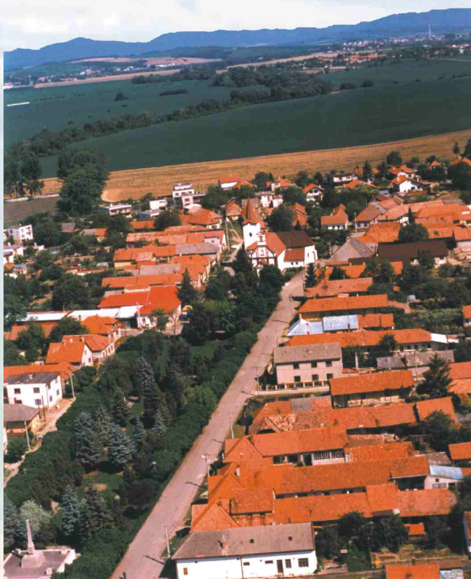
Letecký pohľad na námestie