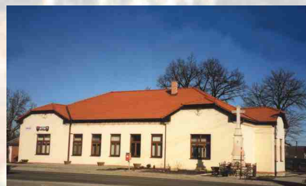
Budova obecného úradu