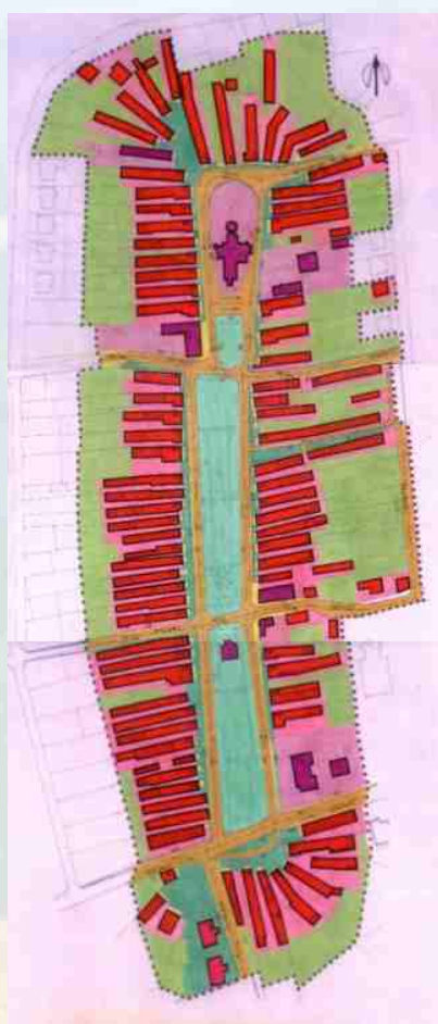
Komplexný urbanistický návrh