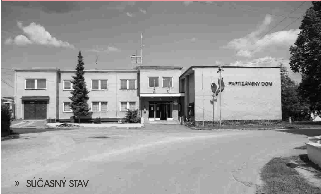
» SÚČASNÝ STAV

Podhorskej obci Malinová dominuje centrálny priestor, kde podľa pamätníkov a historických prameňov bolo návršie s výsadbou troch líp a sochou sv. Trojice.