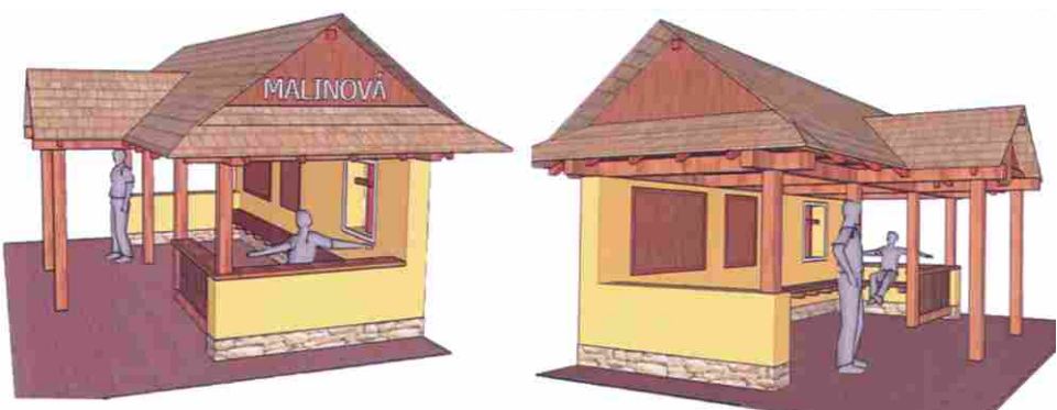
» VIZUALIZÁCIA AUTOBUSOVEJ ZASTÁVKY A VSTUPNEJ BRÁNY DO AREÁLU KOSTOLA